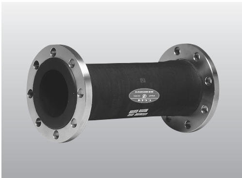
※SUSフランジはオプションです。

防音・防振用の柔軟性直管タイプのゴムジョイントです。 本体にワイヤが入っていないので手で押してつぶれる非常に 柔らかいタイプのゴムジョイントです。