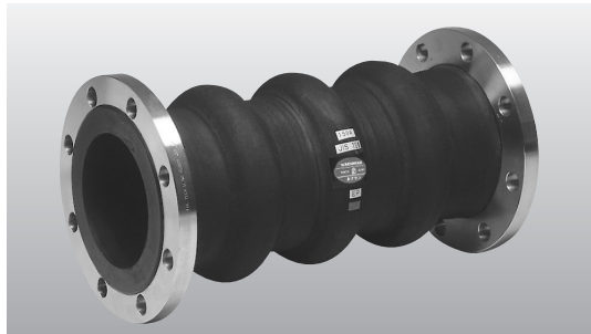
※SUSフランジはオプションです。