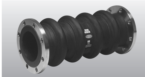
※SUSフランジはオプションです。